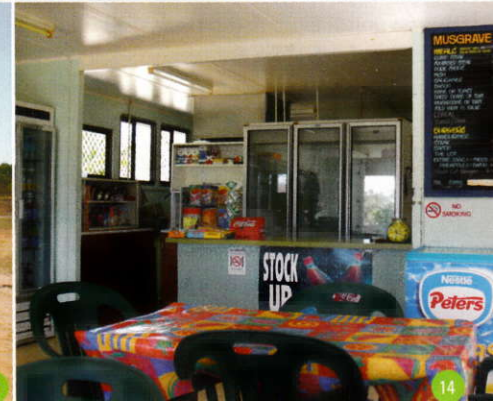
01• Blue winged kookaburra 02• Koffiestop langs de weg 03• Waarschuwbord voor krokodillen 04• Gould's goanna, deze kan wel twee meter lang worden 05• Kangaroo 06• Een gould's goanna verspert de weg 07• Kangaroo met jong op één van de 'bush campings' 08• Een gewaarschuwd mens telt voor twee! 09• Roodstaart zwarte kaketoets 10• De hoofdweg met de overal opduikende termietenheuvels in de berm 11• Afkoelen in het water met gevaar voor eigen leven 12• Eén van de vele lange 'roadtrains' 13• De 'airstrip' bij een 'roadhouse' 14• 'Roadhouse'